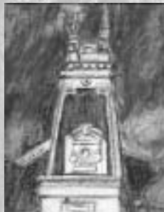
M.T. de Alvear y Montevideo

Una de las características salientes de los edificios de la ciudad de Buenos Aires, es el coronamiento en cúpulas, torres y mansardas.