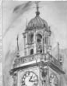
Torre de los Ingleses