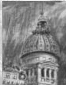
Congreso de la Nación